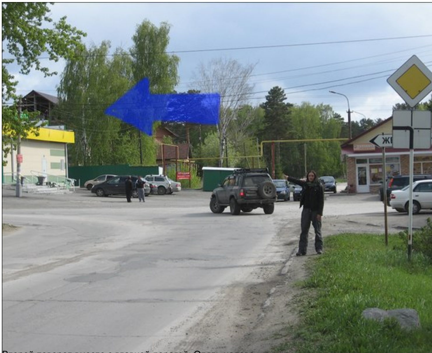
Второй поворот вместе с главной дорогой. Опять налево.

01.05.2009 00:00 - Обновлено 01.06.2015 15:33